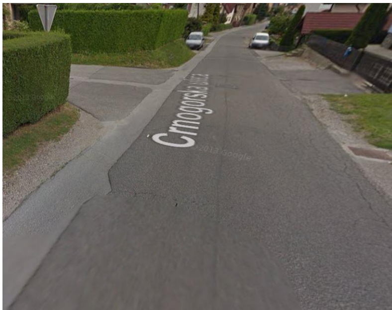
Slika 2: Križišče brez prehodov za pešce (Črnogorska)

da so kar najbolj odmaknjeni od cestišča. Previdni morajo biti, ko prečkajo ceste, kjer ni označenih prehodov za pešce, teh pa je po našem šolskem okolišu veliko.