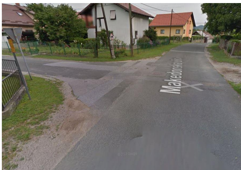
Slika 3: Tudi Makedonska nima prehodov za pešce