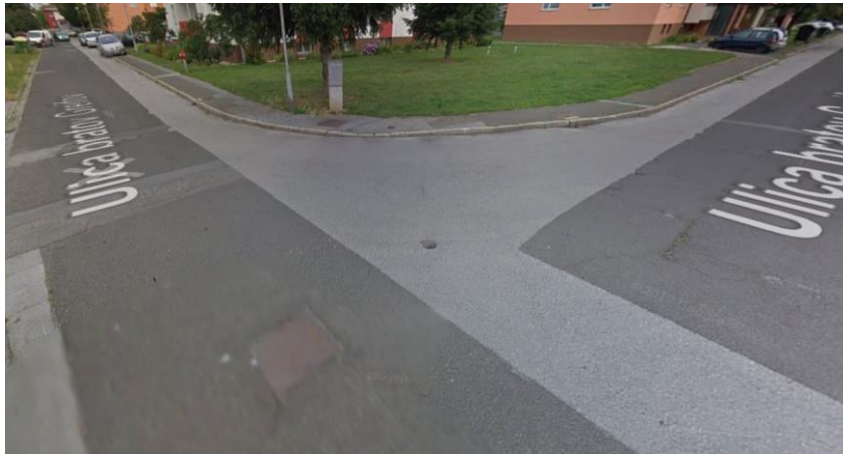
Slika 4: Ulica bratov Greifov prav tako brez »zebre«