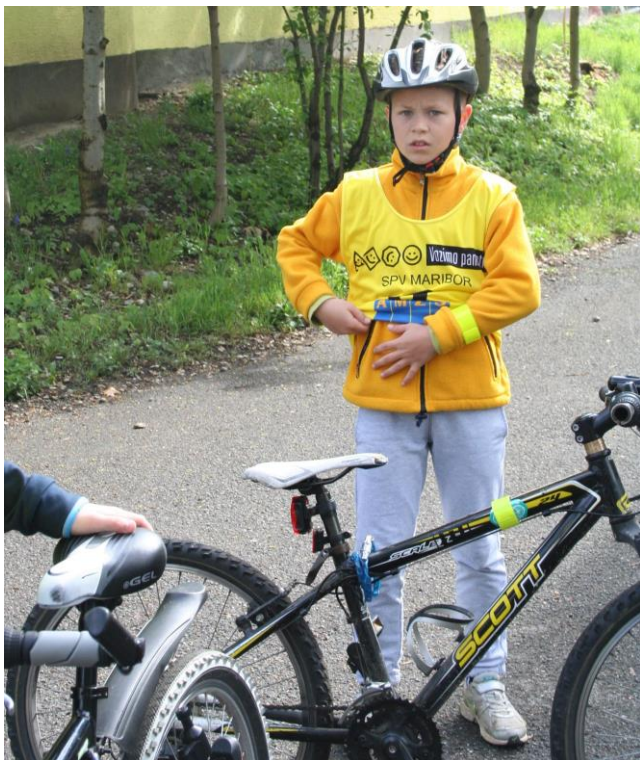
Slika 5: Letošnji udeleženec državnega tekmovanja